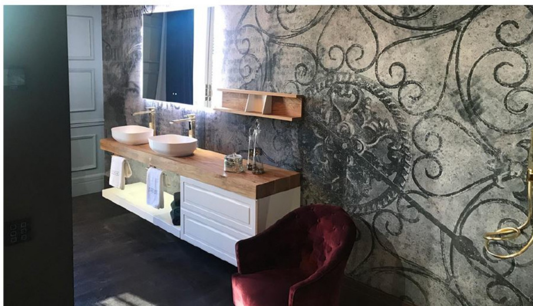
El interiorismo de WEcontract BCN se inspira en los elementos de la naturaleza: Agua, Tierra, Madera, Metal y Fuego, que sirven de hilo conductor.